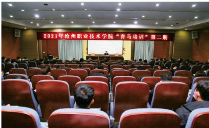
2021年沧州职业技术学院“青马培训”第二期